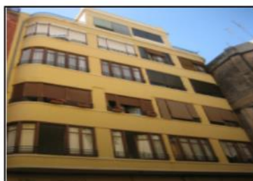
Venta directa. Llaves en mano.